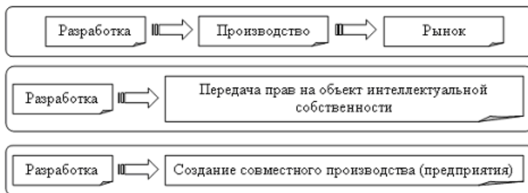
Рис. 2. Формы коммерциализации интеллектуальной собственности

Формы коммерциализации объекта интеллектуальной собственности представлены схематично на рис. 2.