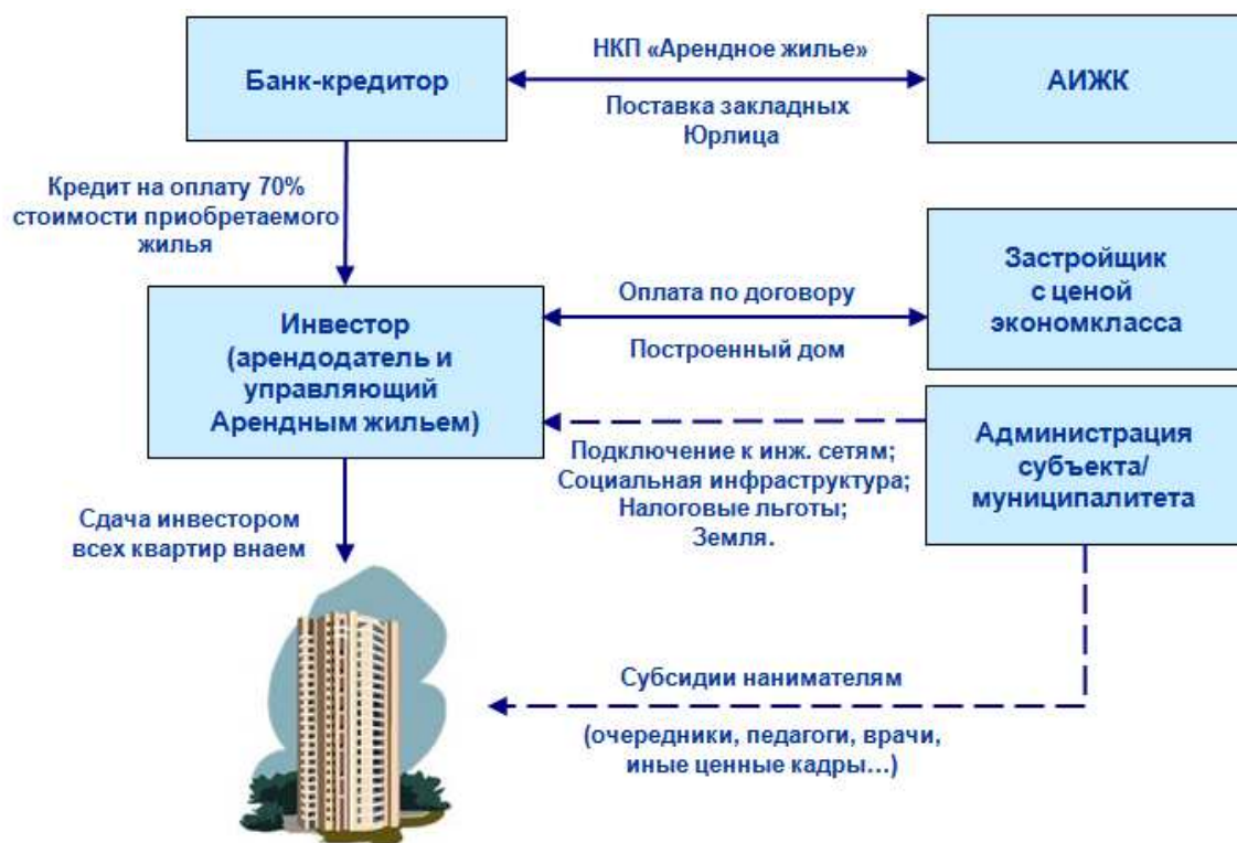
Рисунок 1 - Программа «Арендное жилье»

Программа «Арендное жилье» предусматривает рефинансирование агентством кредитов, выданных банками-партнерами АИЖК (73 банка) юрлицам на строительство жилых объектов для последующей их сдачи в аренду. Кредиты будут выдаваться на строительство жилья экономкласса. Сумма кредита от 5 до 500 млн рублей, максимальный срок — 20 лет. Кредит не может быть предоставлен более чем на 70% от стоимости объекта строительства. Процентная ставка по кредиту варьируется в зависимости от соотношения размера кредита к стоимости залога и срока кредитования и может составлять 8,8-11,7% годовых.