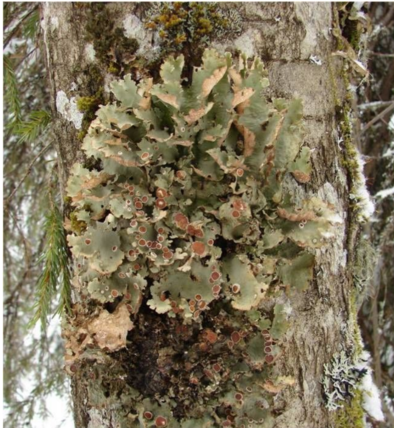
Рис. 1. Стикта Райта на стволе рябины сибирской.

Верхняя поверхность слоевища голубовато-зеленовато-сизая, светло-серовато-оливковая, иногда с буроватым оттенком, слегка блестящая или более или менее матовая, гладкая, более или менее ямчато-неровная, местами слабо морщинистая, без соредий и изидий. Нижняя поверхность на периферии светло-буроватая, по направлению к центру темно-бурая до почти черной, густо- и коротковорсистая, по краю лопастей более или менее узкая полоска голая. Цифеллы рассеянные, многочисленные, мелкие на периферии, и более крупные в центральной части. Апотеции крупные, до 8 мм в диаметре, сидячие. Диск темно-красновато-коричневый, вначале вогнутый, затем с неровной поверхностью, обведенный тонким, мелкокренулированным, иногда мамилезным, вначале загнутым внутрь слоевищным краем, позднее почти исчезающим.