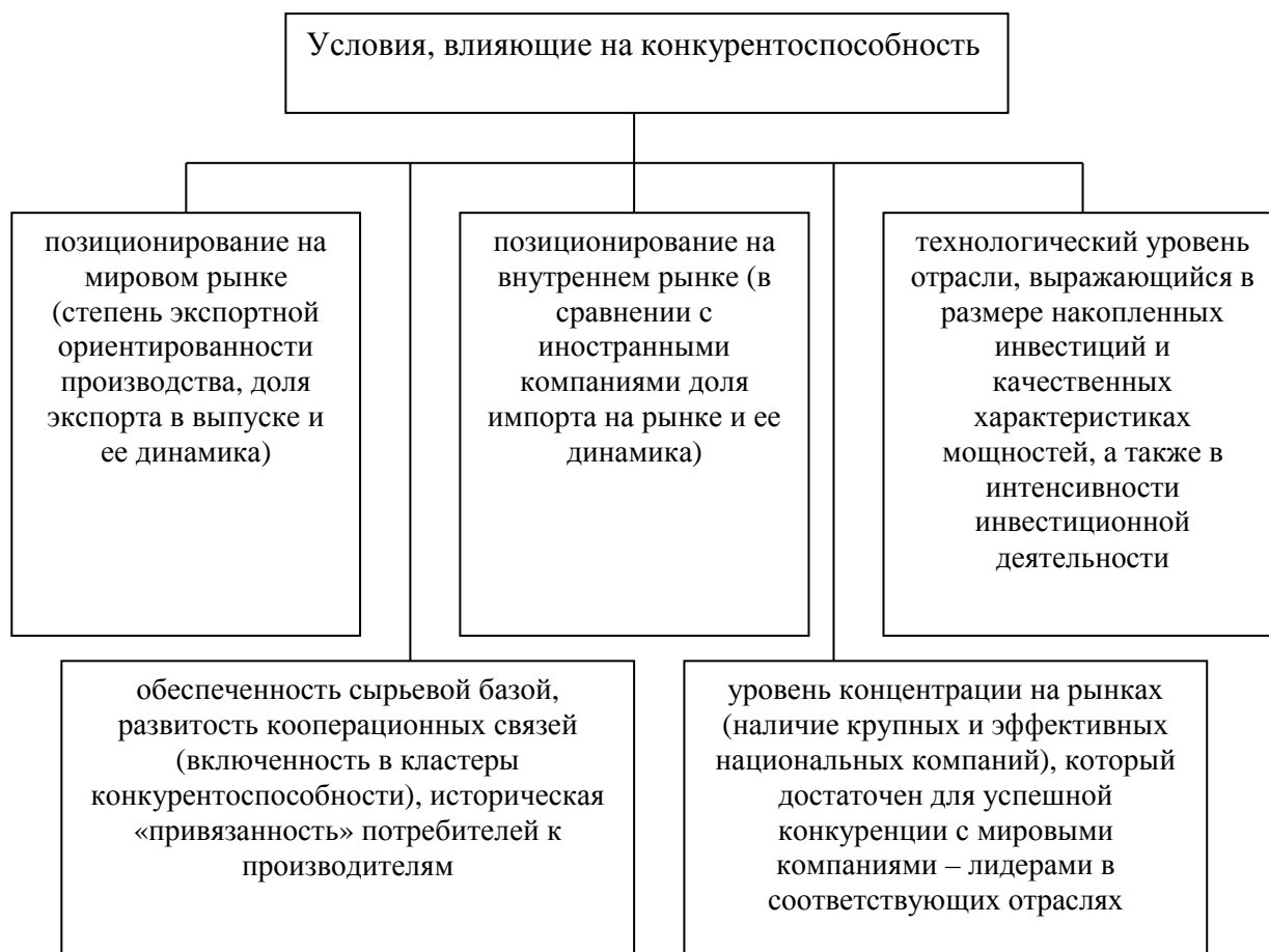
Рисунок 2. Условия, влияющие на конкурентоспособность