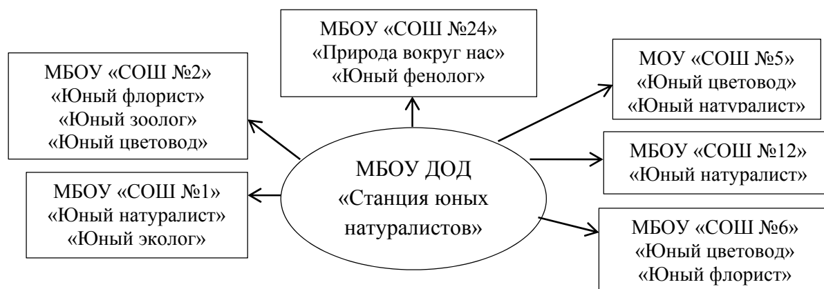
Рис. 3. Образовательное пространство МБОУ ДОД «Станция юных натуралистов»

Рассмотрим модель экологического образования на примере города Партизанска Приморского края. В 1958 году в целях повышения качества экологического образования школьников в г. Партизанске было создано МБОУ ДОД «Станция юных натуралистов». В настоящее время «Станция юных натуралистов» имеет свои подразделения в разных школах города (рис. 3).