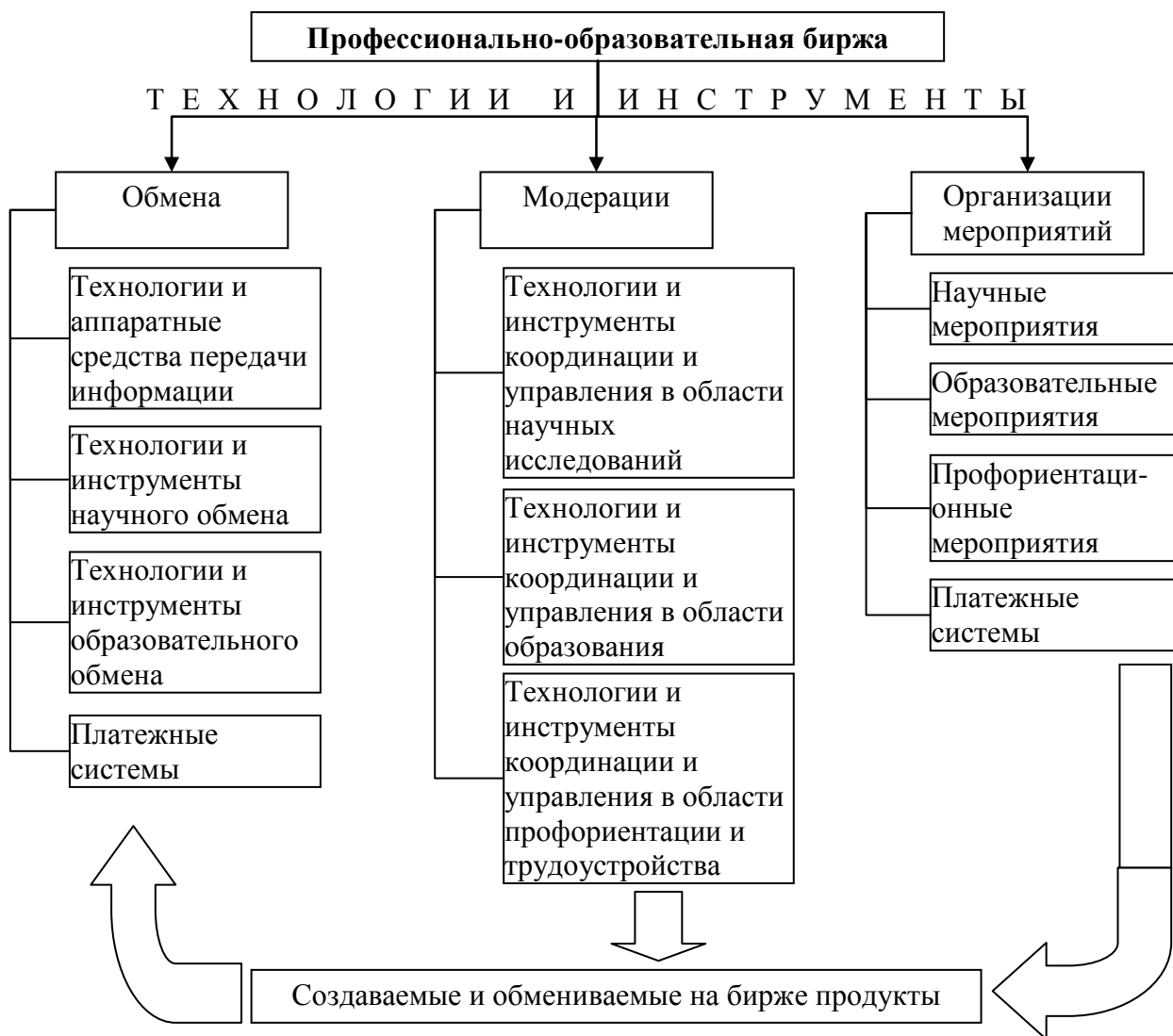
Рис. 1. Структура профессионально-образовательной биржи

Профессионально-образовательная биржа должна быть реализована в двух формах: а) как добровольное объединение научных, образовательных, производственных и других организаций, государственных учреждений и физических лиц, а также б) как специализированная виртуальная площадка (портал).